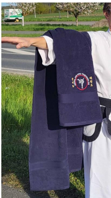
Duschtuch 20,- €

Unisex XS – XL (etwas dunkler) (fällt größer aus, passt über Dobok) bessere Qualität (320g/m 2 )